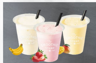
ミルクスムージー