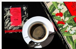
カフェインレスコーヒー