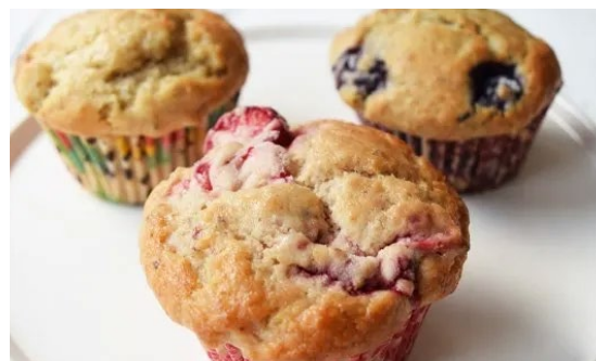
ヴィーガングルテンフリーマフィン (いちご or ブルーベリー or バナナ)