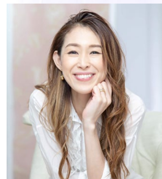
FELICITA+ 酒田店 オーナー

フェリチタプラスでは、 「いつまでも美しく健康に、イキイキと生活できるカラダづくり」を、 インナービューティーカフェが発信する 「心と身体のセルフケアによる生活習慣」を通じて、 自分のカラダの機能を高め、 自らのチカラで美しく健康でいられる土台づくりを提供します。 忙しい毎日でも頑張るあなたに「いつまでも」寄り添い サポートしていくことが私たちの使命です。