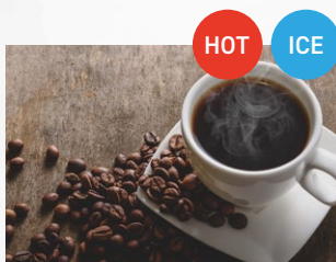
オーガニックコーヒー フェリチタオリジナルブレンド