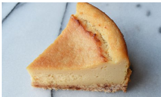
ヴィーガンチーズケーキ(プレーン)