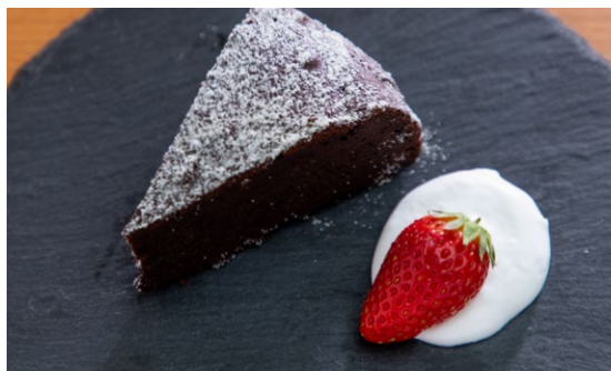
フェリチタガトーショコラ