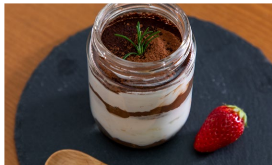
魔法のティラミス